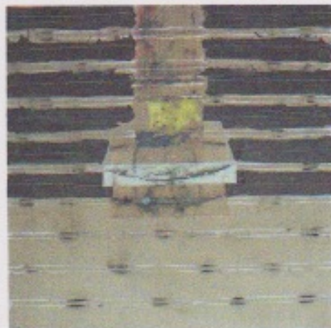
Georges Nadra: 1er élément du Grand triptyque rouge technique mixte sur lin, 100 x 100 cm

besoin d'aller chercher ailleurs», nous confie le taille-doucier. De ce travail d'approfondissement qui a souvent pour point de départ la forme d'un nuage, le corps humain, une souche de vigne, un végétal, la terre, naît un ensemble de gravures où la